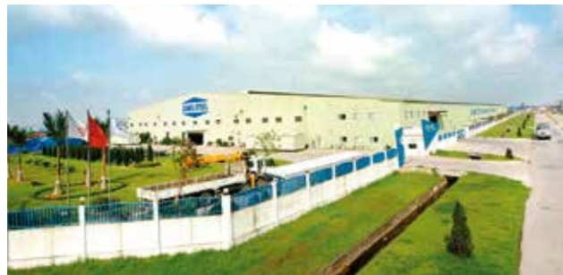
Nhà máy Hà Nội tại Khu Công nghiệp Nội Bài, Hà Nội, Việt Nam.

Được xây dựng năm 1997, sản xuất các sản phẩm Nhà thép tiền chế và các kết cấu khung chính.