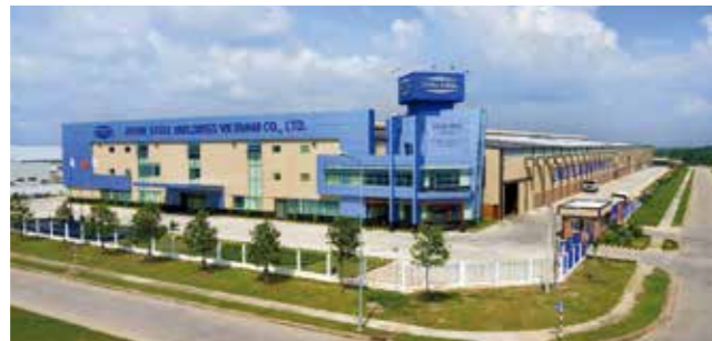
Nhà máy Đồng Nai tại Khu Công nghiệp Amata, Đồng Nai, Việt Nam.

Khánh thành năm 2008, được trang bị các máy móc và các thiết bị hiện đại phục vụ cho sản xuất Nhà thép tiền chế và Kết cấu chính.